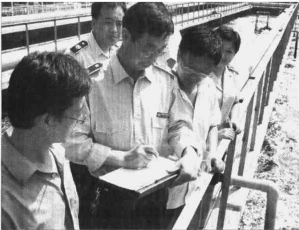
垦利县积极探索环境管理新机制，全面推行了污染治理驻厂员、环境管理监督员、污染举报信息员“三员管理”制度...