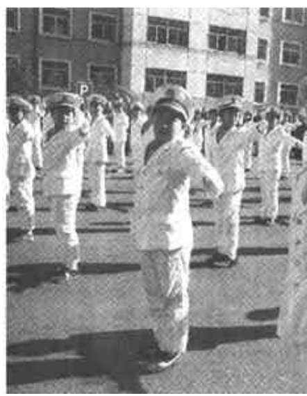
10月16日，胜利油田景苑社区内鼓声阵阵，市交警支队直属二大队与该社区组织的警民共建交通安全小区启动仪式在这里举行，来自该社区的小学生们

“中黄十三号”大豆是一种优质品种，具有抗虫、抗涝、抗盐碱等优点。今年3月，崔家村新开发土地4000亩，与东营市万福得植物蛋白科技有限公司签订了种植产销合同。在今年遇上多年少涝灾的情况下，“中黄十三号”大豆仍然丰产丰收，亩产比本地大豆高47%，价格是本地大豆的1.2倍。仅此一项，崔家村人均增收700元。（召伟 景武 克明）