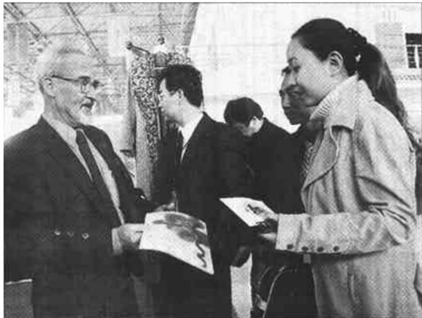
在本次会议洽谈会上,英国因沃尼斯市代表团向参观者介绍他们富有浓郁的苏格兰特色的产品。

展的车辆60%由济南、青岛、淄博等外地购进,集中了相同价位和不同档次的各种车型。目前,市场已覆盖我市三区两区,并正在向周边的淄博、潍坊、滨州辐射,随着我市经贸洽谈会的召开,以及汽车交易市场影响及辐射力的日趋扩大,汽车交易市场正逐步显示出诱人的发展前景。(记者 王志峰)