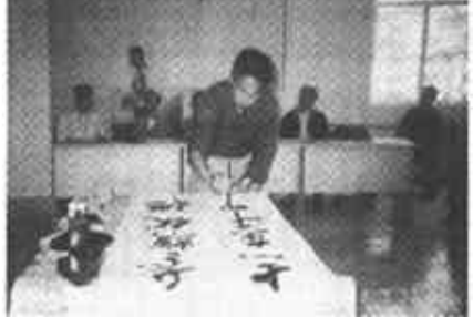
日前，明月社区与金翰集团清风湖物业公司联合举办了老年人联谊会。社区内的老年人欢聚一堂，畅谈东营建市二十周年的巨大变化。图为老年人正在兴致勃勃的泼墨抒情。