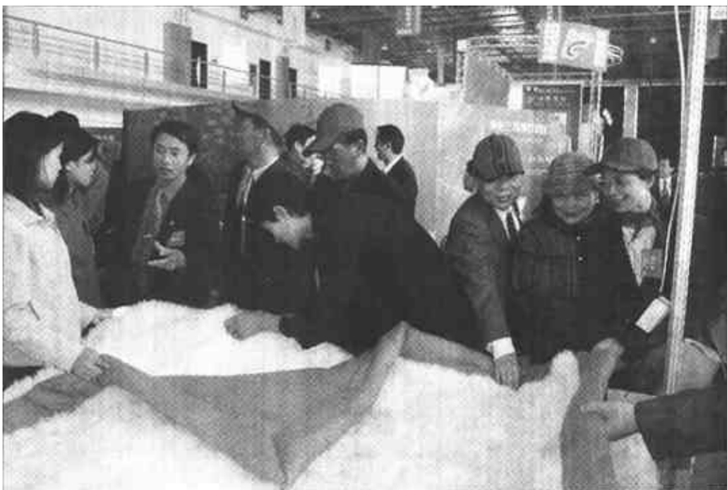
在经贸洽谈会上，来自国内外的客商纷纷将自己的产品、技术及所需合作的项目展示出来，以寻求合作伙伴。图为来自内蒙古大草原的客商在展示羊绒制品。