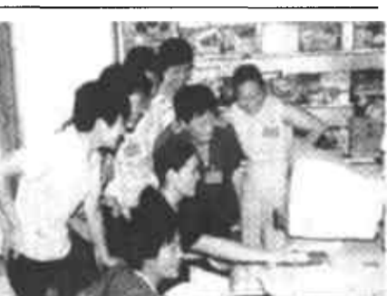
在广饶县大码头乡二村有一大批女人“说了算”的家庭，她们个个都有一套让男人们服气的本事，她们为村里的经济和精神文明建设起了积极的模范带头作用，深受乡亲们欢迎和称赞。图为妇女们正在网上交易。在生产经营中，她们个个都是能手。