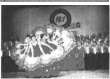
河口区建设者们满怀豪情，载歌载舞，欢庆建市二十周年。

首集市场的改造均得到了当地老百姓的大力支持和拥护。记者在随同首集市场改造竣工验收小组采访时，很多当地老百姓都说：“市场改造，是切切实实为我们办了一件大实事，以后赶集好了，下雨不用再趟泥窝，刮风不怕尘土了。”